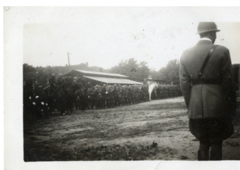
Prise d'armes 3e BDP—1931

« pas de Samu, sirènes hurlantes, feux clignotants dans les dix minutes ou même moins suivant le drame, avec tout l'arsenal médical et le personnel spécialisé...comme aujourd'hui... »