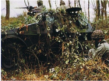
VBL de l'EED3 STETTEN—1994