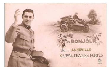
Carte de vœux 3e RDP—1940

« Entre Rouen et Duclair nous avons pris à bord deux dames et un petit enfant... »