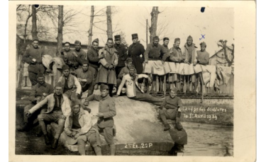
Lavage des doublures 2e peloton du 2e escadron 3e BDP—Avril 1939

M. LEYDIER nous a quitté le 16 juin 2008