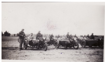
Peloton motocycliste 3e BDP—1931

« pas de Samu, sirènes hurlantes, feux clignotants dans les dix minutes ou même moins suivant le drame, avec tout l'arsenal médical et le personnel spécialisé...comme aujourd'hui... »