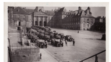
Rassemblement de véhicules 3e BDP-1931

« L'avenir de l'amicale dépend de notre volonté et de nos capacités... »