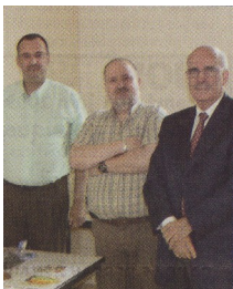
Le Conseil d'Administration de l'amicale

En fin de matinée nous avons reçu la visite d'une journaliste d'un hebdomadaire local et lui avons donné les informations nécessaires à l'écriture de son article.