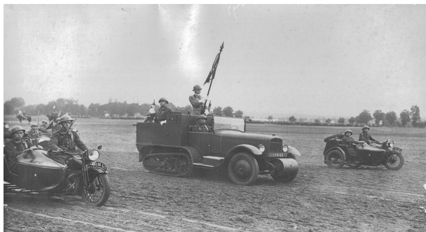
Etendard du 3 e Bataillon de Dragons Portés