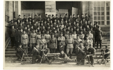
Escadron de mitrailleuses 3e BDP -1931

Les plantons de la circulation routière étaient là pour nous mettre sur la bonne voie.