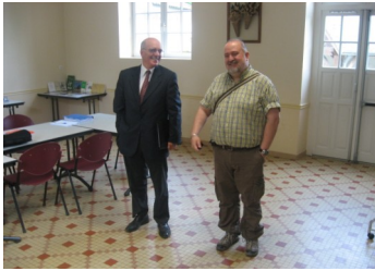
Le Président et le Trésorier...