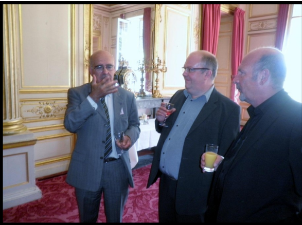
Petits moments de détente avant le repas

Cet article n'a pas vocation à vous présenter l'intégralité des débats de l'assemblée générale que chacun pourra retrouver sur notre site internet, alors place à l'image des moments de convivialité :