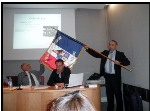
Le drapeau de l'amicale

Le conseil d'administration et le bureau de l'amicale ont été renouvelés et les actions futures décidées.