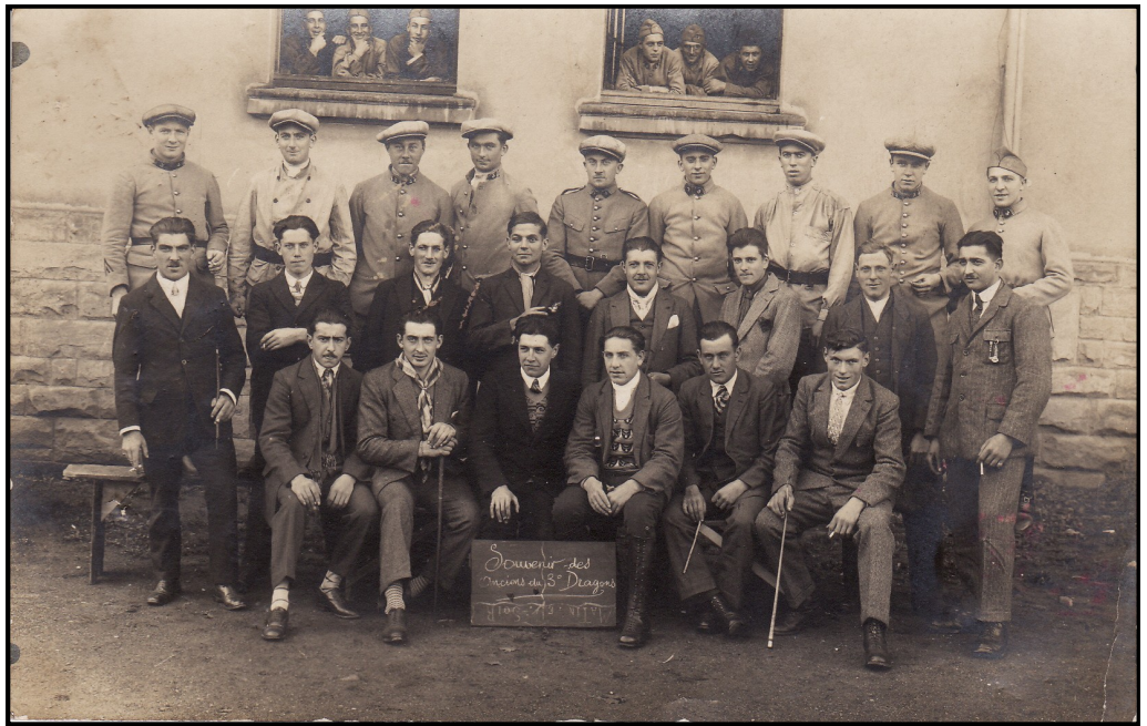
Les Anciens du 3 e dragons en 1927 à SARREGUEMINES ( Carte postale de 1927)