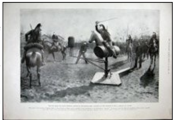
Exercices au cheval de bois au 3ème de dragons de Nantes

Symbole suprême de l'utilité de ce cheval d'escrime, l'école spéciale militaire de Saint-Cyr fit l'acquisition d'un exemplaire de ce matériel.