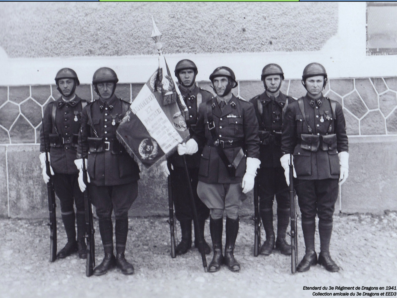
Etendard du 3 e Régiment de Dragons en 1941 Collection amicale du 3 e Dragons et EED3

numéro 7 – mars 2013 - http://www.3emedragons.fr