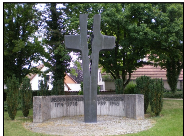
Le monument aux morts