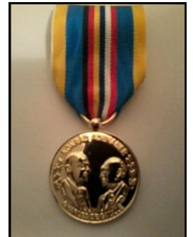
Médaille du 50e anniversaire du traité de l'Elysée...