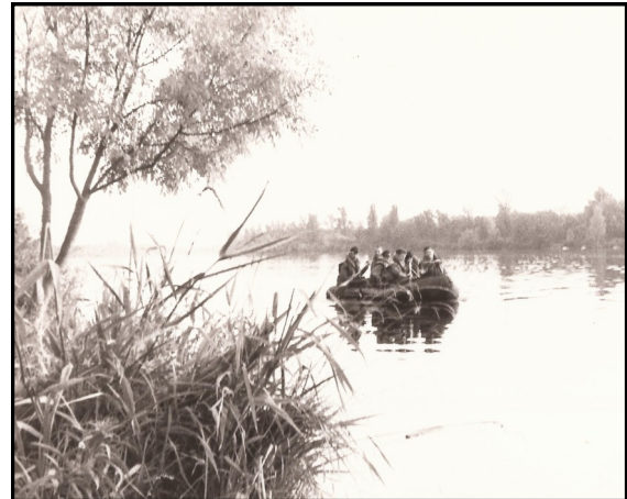
Stage Commando à Vieux-Brisach - 1983