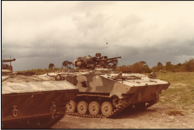
AMX-10P du 5e porté en manœuvres à Mourmelon - juin 1982