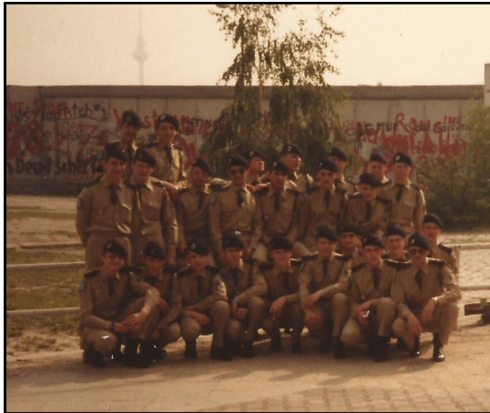
2e peloton du 5e porté à Berlin - 1983