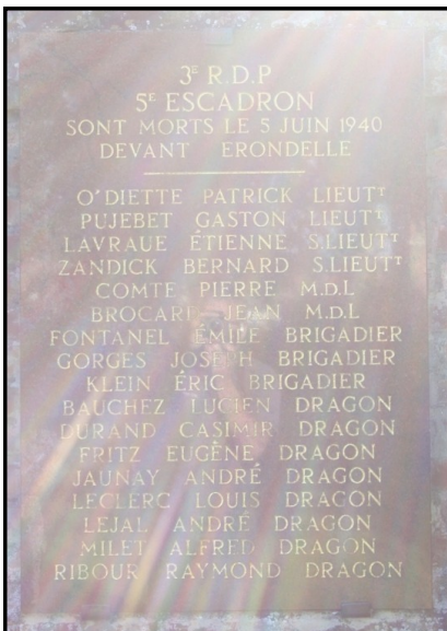
Plaque commémorative du 3e RDP à Erondelle