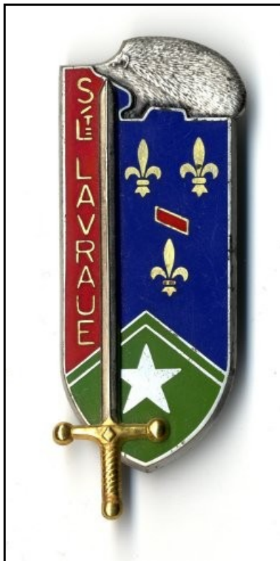
Insigne de la 704e promotion EOR S/Lt LAVRAUE

Son nom figure sur la plaque commémorative du 3ème RDP à Erondelle et sur celle à l'école libre des sciences politiques (Paris 7e).