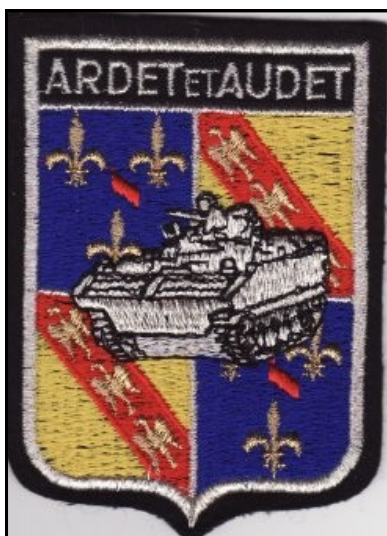
Insigne tissus du 5e escadron porté Collection amicale du 3e Dragons et EED3