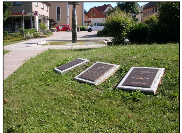
Les trois plaques