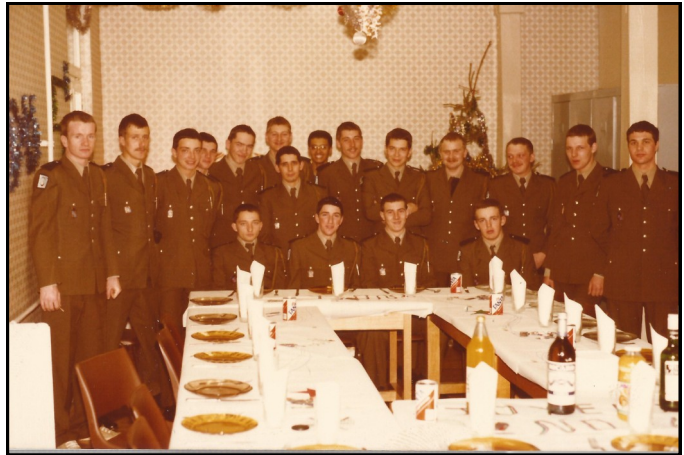
Repas de Noël du 2e peloton du 5e porté - Stetten décembre 1982