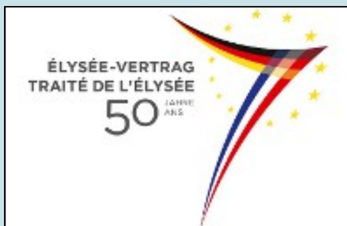
Logo du cinquantième anniversaire du traité de l'Élysée