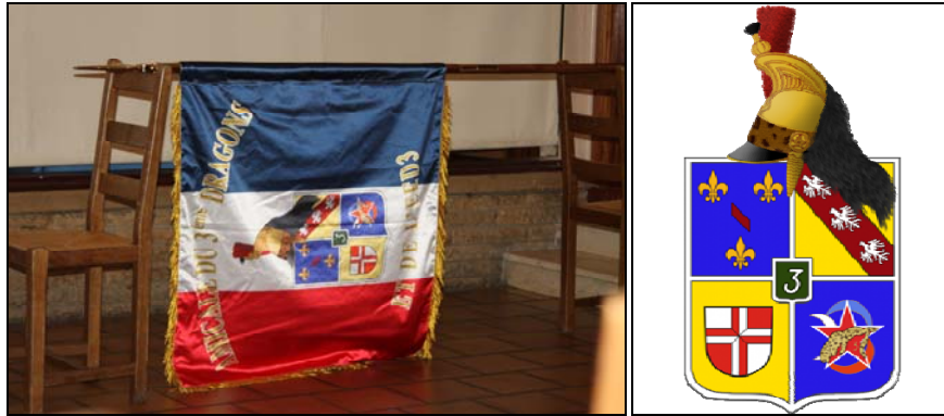
Drapeau de l'amicale

La commande a été prise le 20 avril et après 3 bons à tirer, le drapeau est présenté pour la première fois aux membres de l'amicale de ce jour.