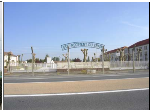
Ancienne entrée du 517 e Régiment du Train

Il se compose de 3 escadrons de transport blindés (ETB), 1 escadron de circulation routière (ECR), 1 escadron de commandement et de logistique (ECL), 1 bureau organisation et instruction (BOI), 1 centre d'instruction élémentaire de conduite (CIEC) et 1 unité de réserve d'arme de régiment professionnel (à base de réservistes)