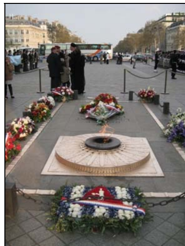
Flamme du soldat inconnu

MM. BONNETERRE et PORTRON ont assisté, au nom de l'amicale et au sein de l'U.N.A.B.C.C, au ravivage de la flamme du soldat inconnu sous l'Arc de Triomphe le 15 avril dernier. Ils nous ont résumé cette cérémonie avec un reportage photographique. Leur seul regret est de n'avoir pu posséder de drapeau de l'amicale, celui-ci n'ayant pas encore été commandé à cette date.