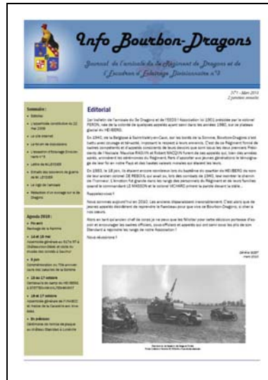
Couverture du premier numéro du bulletin – mars 2010