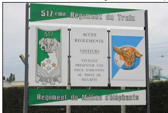
Entrée du 517 e Régiment du Train

Décoré de la Croix de guerre des Théâtres d'opérations extérieures (une étoile d'argent pour une citation à l'ordre de la division), sa devise est « solide et sûr » mais aussi « le Régiment du Million d'éléphants ».