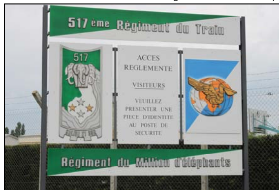
Entrée du 517 e Régiment du Train

Décoré de la Croix de guerre des Théâtres d'opérations extérieures (une étoile d'argent pour une citation à l'ordre de la division), sa devise est « solide et sûr » mais aussi « le Régiment du Million d'éléphants ».