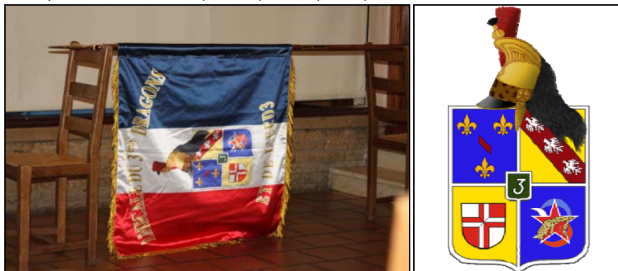
Drapeau de l'amicale

La commande a été prise le 20 avril et après 3 bons à tirer, le drapeau est présenté pour la première fois aux membres de l'amicale de ce jour.