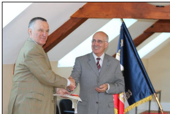
Remise d'un fanion et d'un insigne de l'amicale au général de BROISSIA par le colonel PERON

Avant d'interrompre l'assemblée pour le déjeuner le Colonel PERON remet, en remerciement de son invitation, un fanion et un insigne (numéroté 002) au général Flavien de BROISSIA.