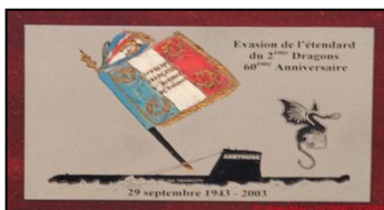
Cadre souvenir de l'évasion du 2 e RD