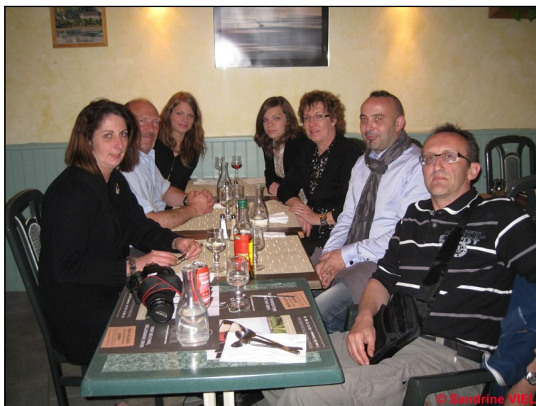
S VIEL, Ici LEMOINE, Miles M & C LEMOINE, C LEMOINE, JM BONNETERRE, F PIEKARSKI

La journée du dimanche demeura au libre arbitre de chacun.