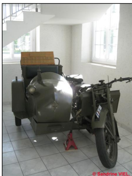
Side-car GNOME & RHONE dans le hall d'entrée du bâtiment PC