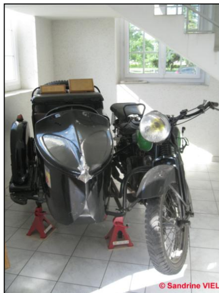
Side-car RENE GILLET dans le hall d'entrée du bâtiment PC