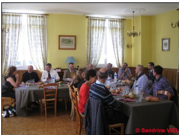
Les participants à l'assemblée générale

« ... Vive la Cavalerie ! » reprirent en chœur les participants.