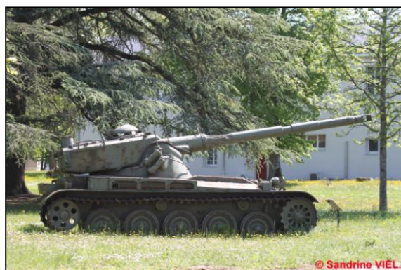
Char AMX-13 du 2 e RD en « pot de fleur » sur le chemin entre le mess et le bâtiment PC

Les informations recueillies sont nécessaires pour votre adhésion. Elles font l'objet d'un traitement informatique et sont destinées au secrétariat de l'association. En application des articles 39 et suivants de la loi du 6 janvier 1978 modifiée, vous bénéficiez d'un droit d'accès et de rectification aux informations qui vous concernent.