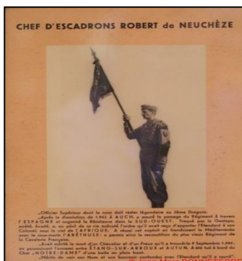
Souvenir du CES de NEUCHEZE qui fit évader l'étendard du 2 e RD, seul étendard décoré de la médaille des évadés.