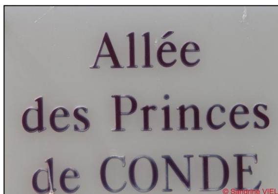
Allée symbolique unissant nos deux régiments empruntée entre le bâtiment PC et le mess

La séance est interrompue à 12h25 pour le déjeuner au mess du chef de corps.