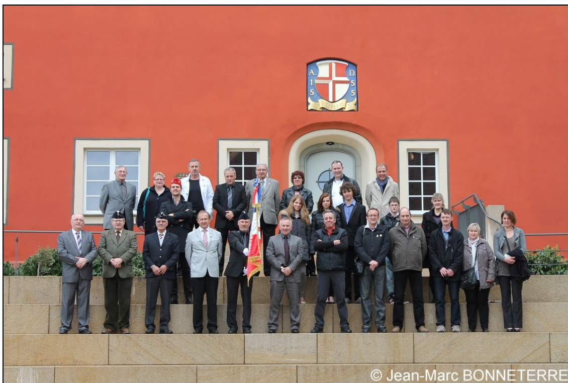
Photo souvenir des participants à l'assemblée générale 2013